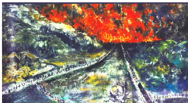
救援列車から見た浦上の街

原爆被爆による混乱の中で、傷ついた人々を救うために救援列車を運行した人達、不眠不休で懸命に救護にあたった人達がいました。