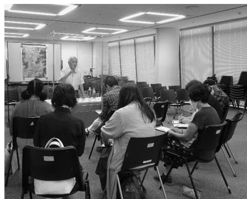
【去年の交流会の様子】

今年度も受け継ぎたい方、託したい方が集まってお互いを知る「交流会」を実施します。興味はあるけど今まで活動したことがない方、これまで被爆体験を語ったことがない方には、色々な方と話すチャンスとなるのではないのでしょうか。是非一度、ご来場ください。