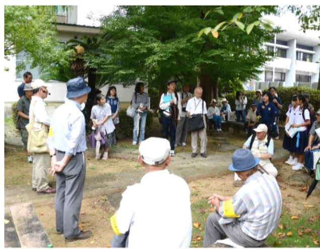
昨年度の碑めぐりの様子