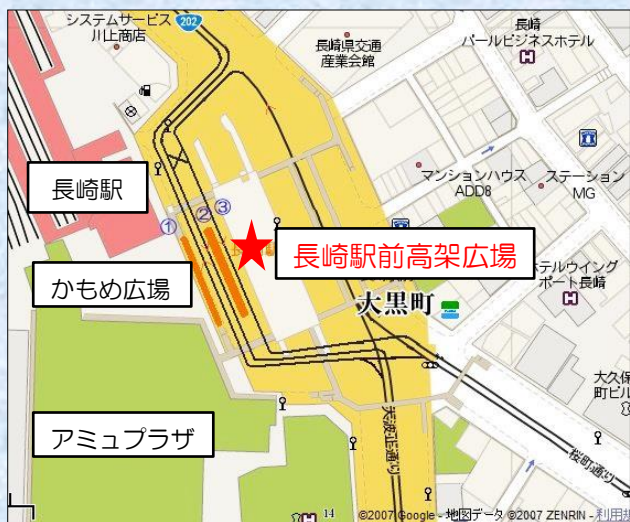
長崎駅前高架広場案内図