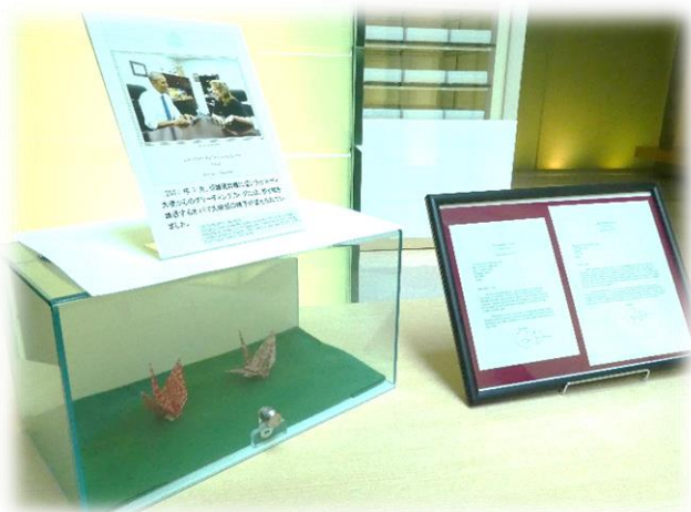
オバマ前大統領の折り鶴とメッセージ

オバマ前大統領が折った折り鶴を4月18日から追悼平和祈念館の追悼空間に展示しています。