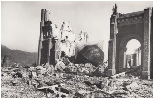
中央に崩落した鐘楼が見える