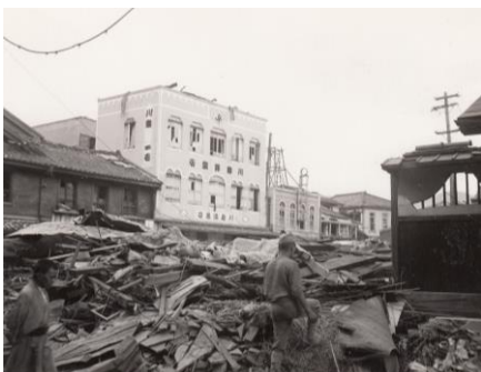
浜の町・旧大丸そば十字路、100円ショップ ダイソー付近