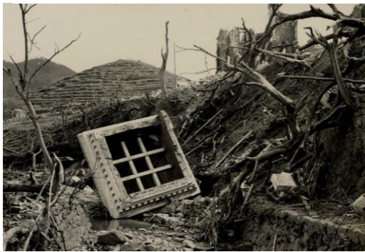
高尾川に崩落したもう一つの鐘楼 現存し、登録記念物となった