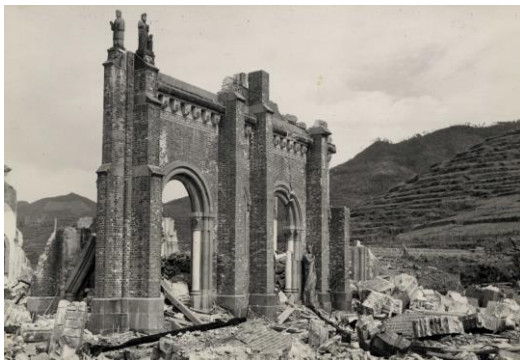
南側の壁面 左端部分が爆心地に移設保存