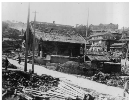
十人町唐人屋敷土神堂(場所は現在と同じ)