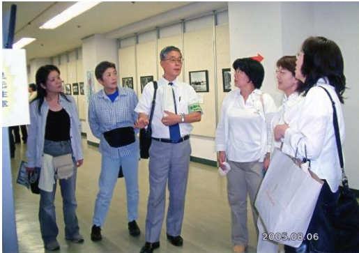
被爆60周年「ナガサキ原爆写真展」の会場風景 (平成17年8月 長崎市民会館)

査部会が市中心部で開催する大型写真展は、被爆60周年「ナガサキ原爆写真展」を長崎市民会館で開催して以来10年ぶりのことです。