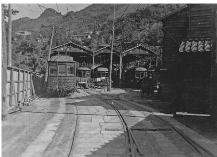
蛸茶屋の電車車庫 深堀部会長はこの付近で被爆した

全市九十軒の浴場のうち現在わずかに四軒、それも大浦方面だけの浴場が営業を開始してゐるといふ惨憺(さんたん)たる状況。もつとも九十軒のう