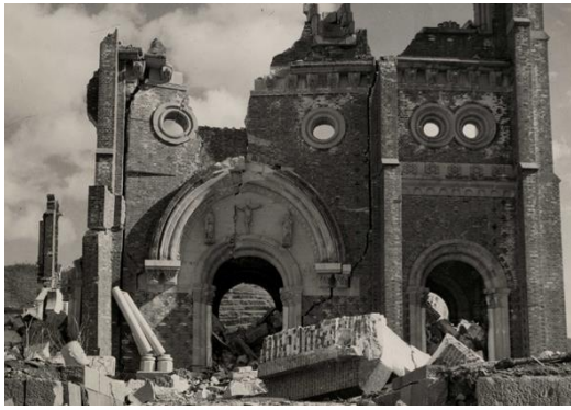
浦上天主堂正面 レンガ建物も強烈な爆風で崩壊