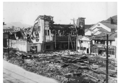
電気館跡 浜町S東東とアーケード街の間にあつた 映画館