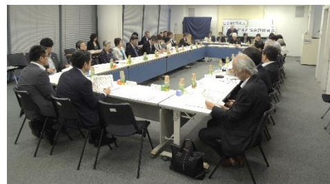
↑ 定時評議員会の様子

新たに選任された方をはじめ、役員(理事・監事)並びに評議員の皆さまにおかれましては、今後とも当協会の事業運営にお力添えをいただきますよう、よろしくお願いたします。