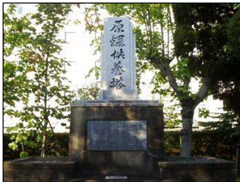
三菱兵器製作所原爆供養塔