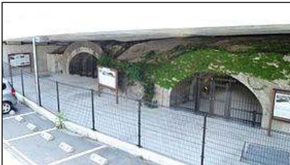
三菱兵器住吉トンネル工場（跡）

※当日は暑くなることが予想されます。参加者には飲み物を用意いたしますが、帽子の着用など熱中症対策をお願いいたします。